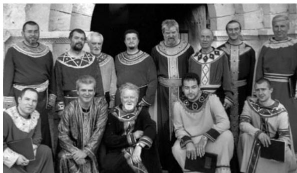
SAINT JEAN DE RILA

Les membres sont originaires de la montagne des Vosges, où se trouvent les trois grandes et belles abbayes de Senones, Moyenmoutier et Etival.