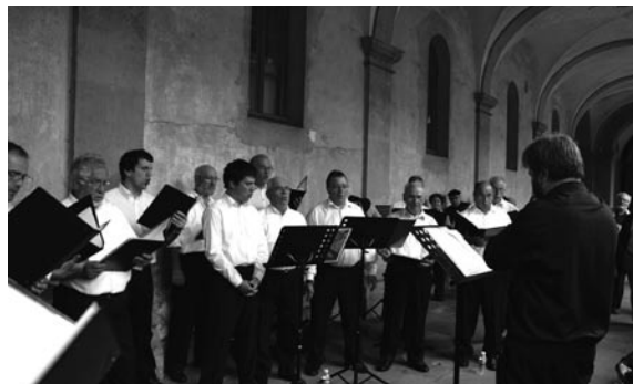
CHŒUR DES 3 ABBAYES