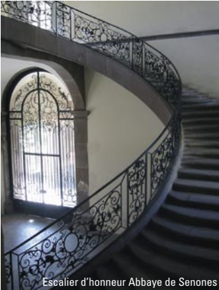
Escaleier d'honneur Abbaye de Senones