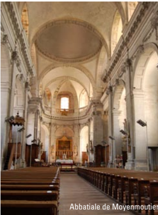
Abbatiale de Moyenmoutier